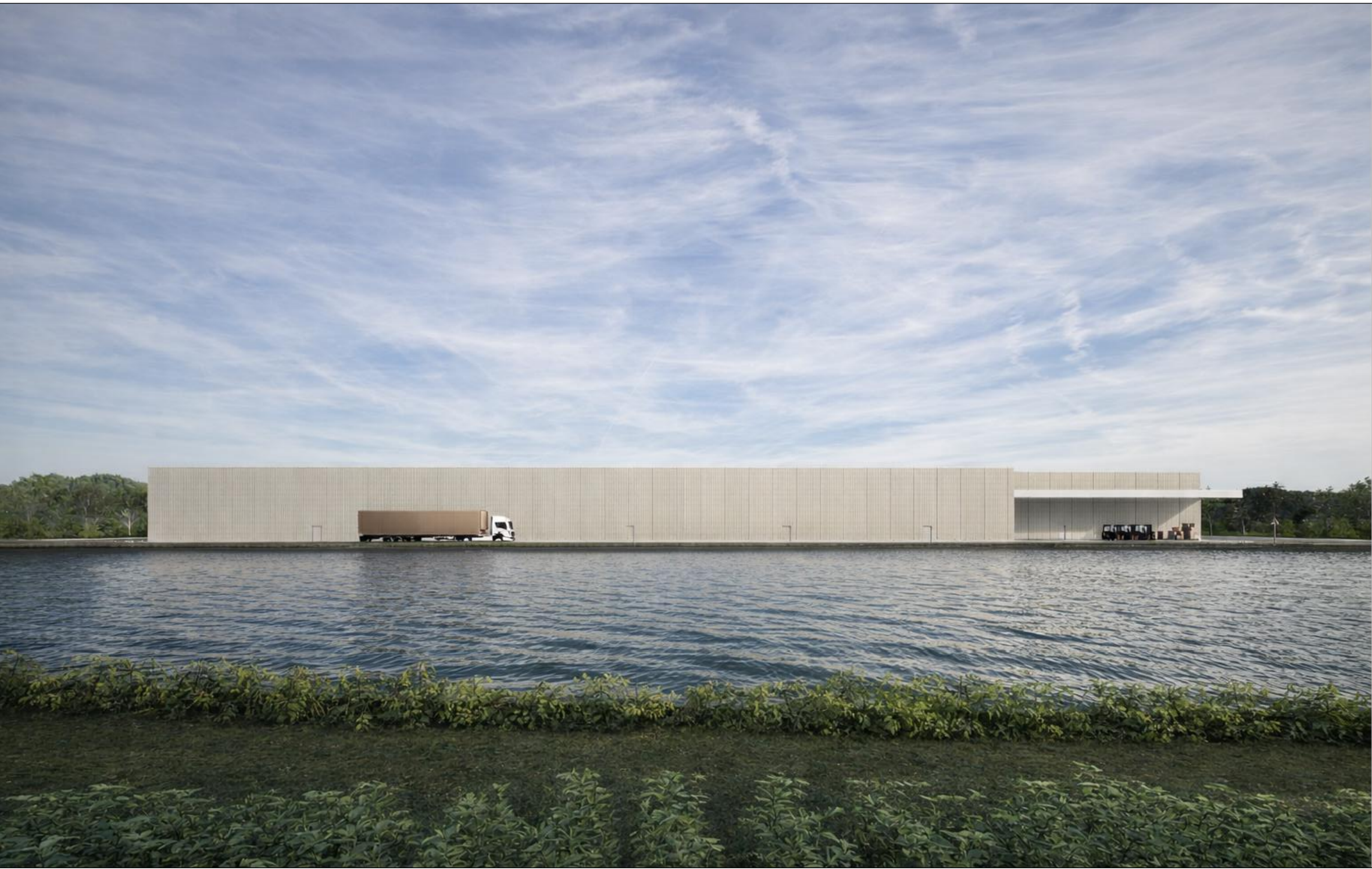
IMM. 04 | Vista del retro del magazzino dal bacino