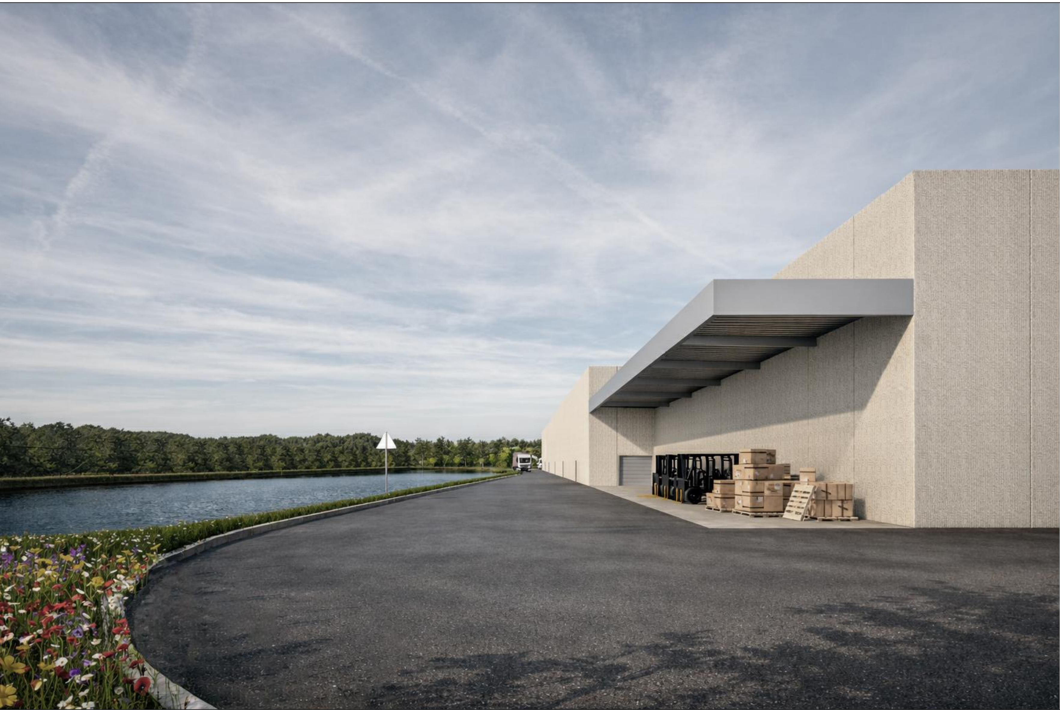
IMM. 03 | Vista dal retro del magazzino