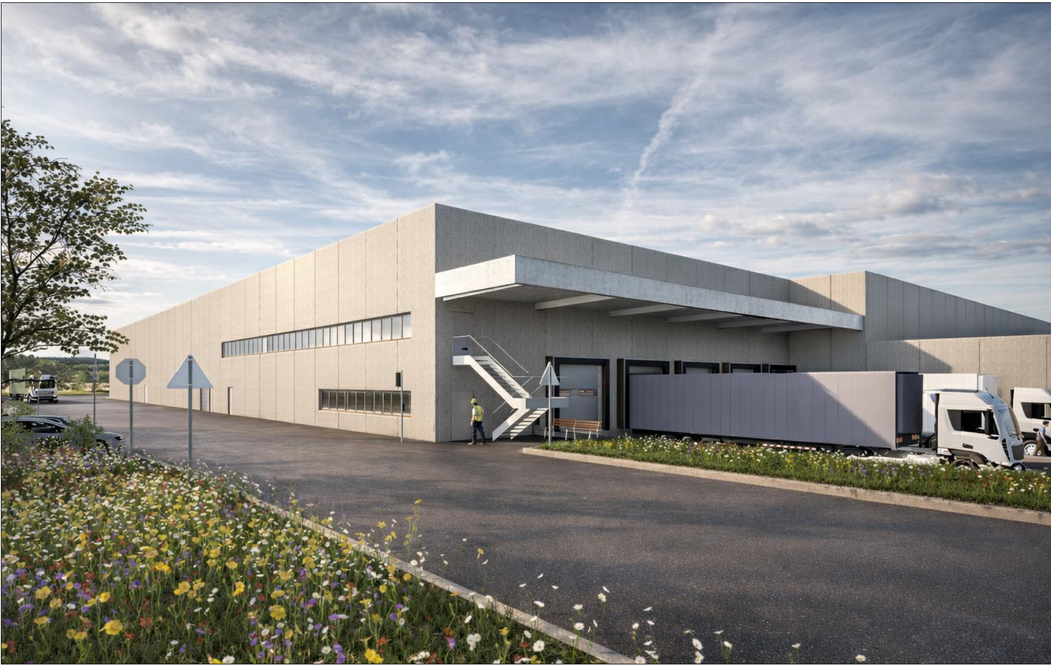
IMM. 02 | Vista delle baie di carico